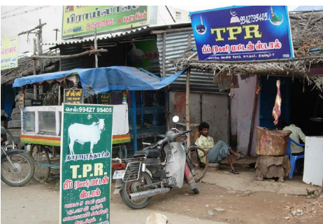
Den lokale slagter. Er der noget der kunne friste?

Se flere billeder og info om Tirupur og tekstilproduktion på www.tekstileroots.dk